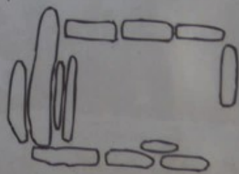
Après restauration Schéma d'après Baudouin et Lacommande